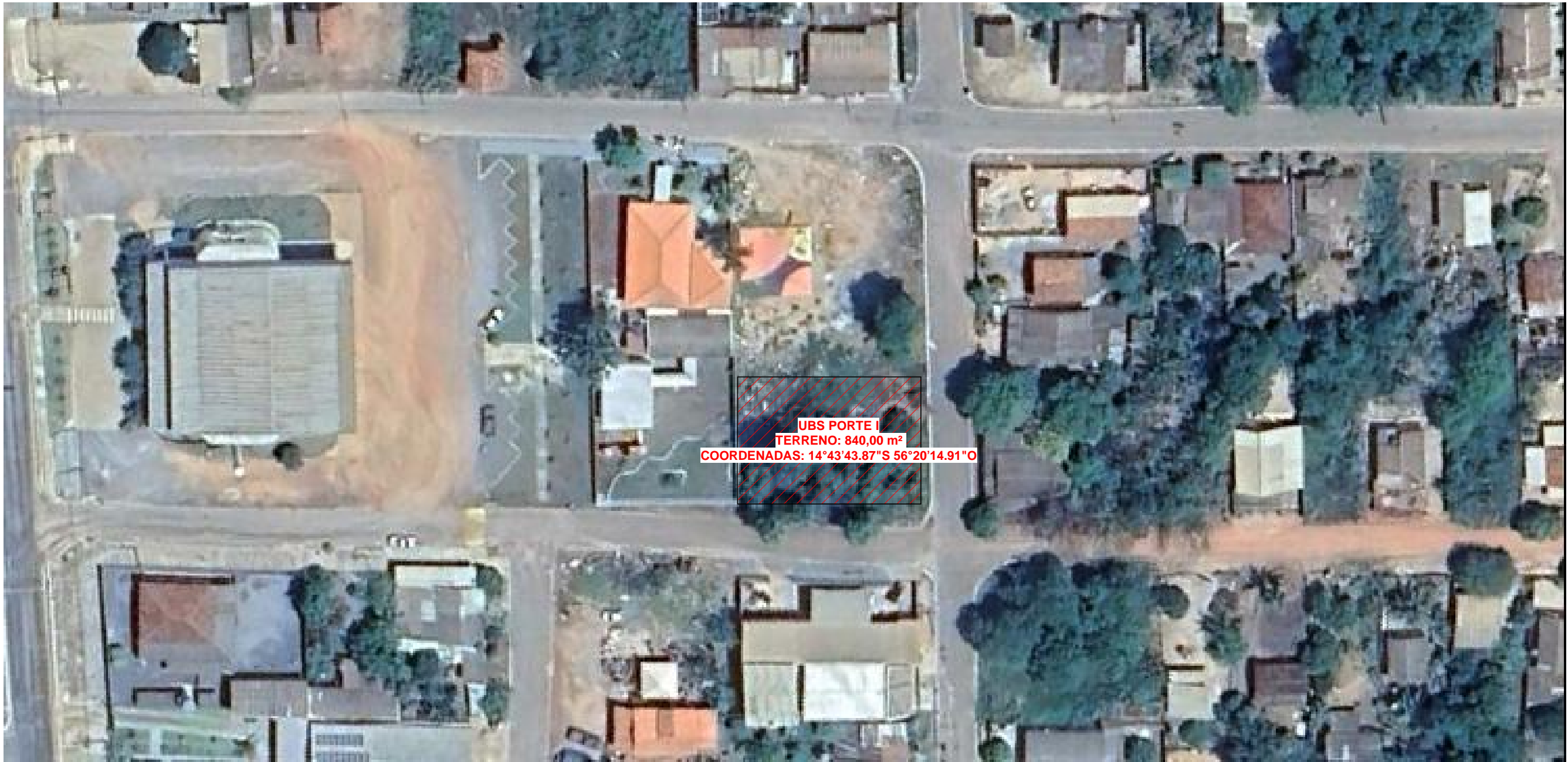
IMAGEM SATÉLITE 1 : 150